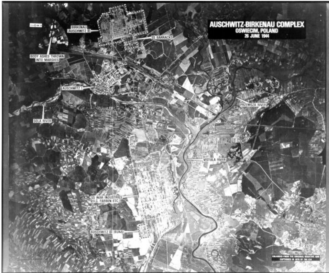
Photo aérienne 26 juin 1944

Ce n'est que vers la fin des années 70 que le débat est lancé sur la volonté ou non des alliés de bombarder le camp polonais d'Auschwitz-Birkenau. Ces derniers savaient pourtant ce qui se passait à l'intérieur de ce camp ; en effet des campagnes aériennes ont été menées par l'armée soviétique également l'armée britannique pour prendre en photo cette terrible usine de la mort.